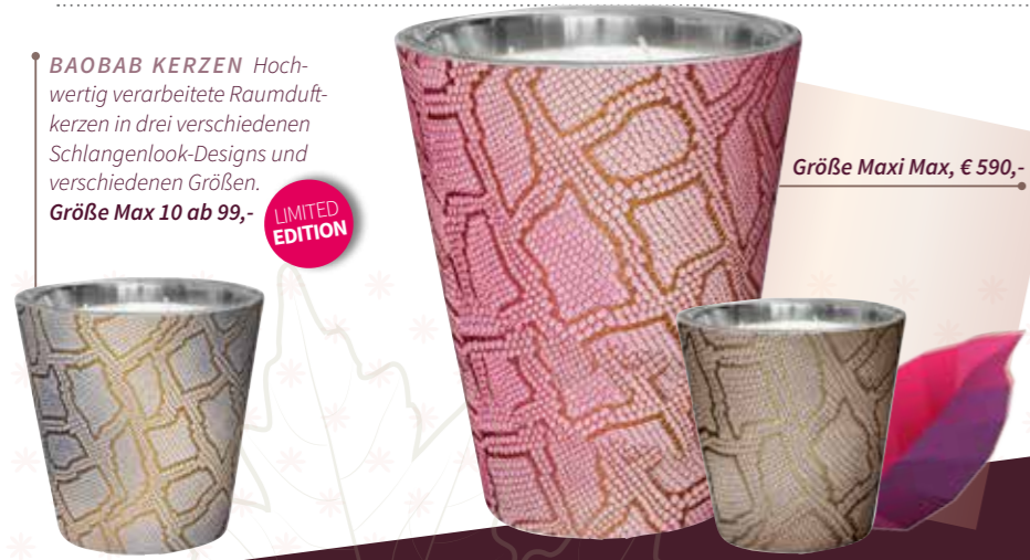
Größe Maxi Max, € 590,-