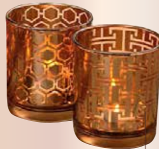
TEELICHTER Verschiedene Muster. € 7,95