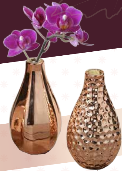
VASEN In unterschiedlichen Ausführungen erhältlich. € 6,95