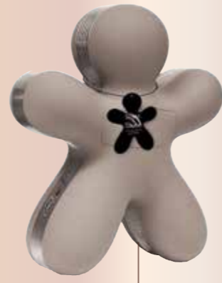
RAUMDUFTSPENDER Mit wechselbaren Duftkapseln auf natürlicher und alkoholfreier Basis und regulierbarer Duftausgabe. € 119,-