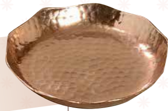
DEKOTELLER In drei verschiedenen Größen erhältlich. Ab € 9,95