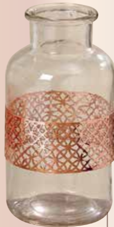
VASE Verschiedene Designs erhältlich. € 9,95