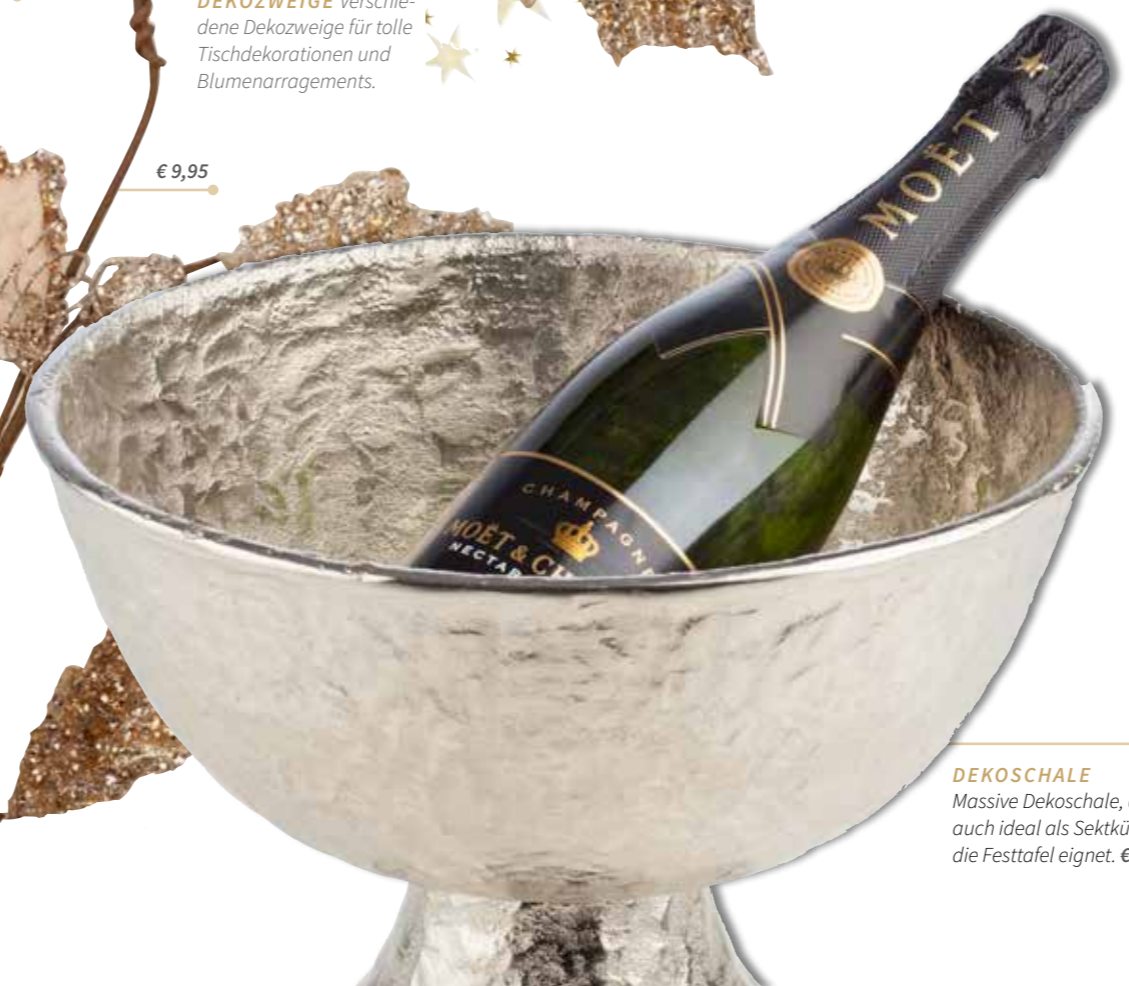
DEKOSCHALE Massive Dekoschale, die sich auch ideal als Sektkühler für die Festtafel eignet. € 99,95