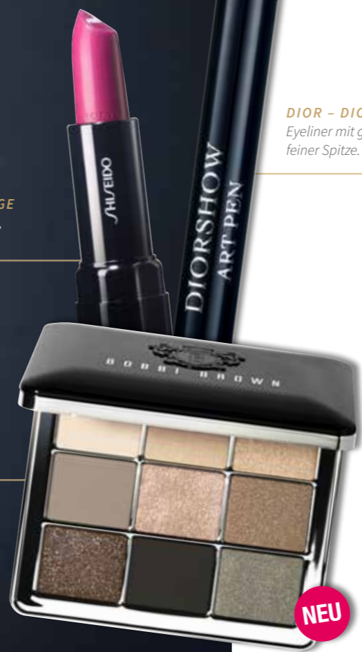
DIOR - DIORSHOW ART PEN Eyeliner mit gelartiger Textur und feiner Spitze. € 36,-