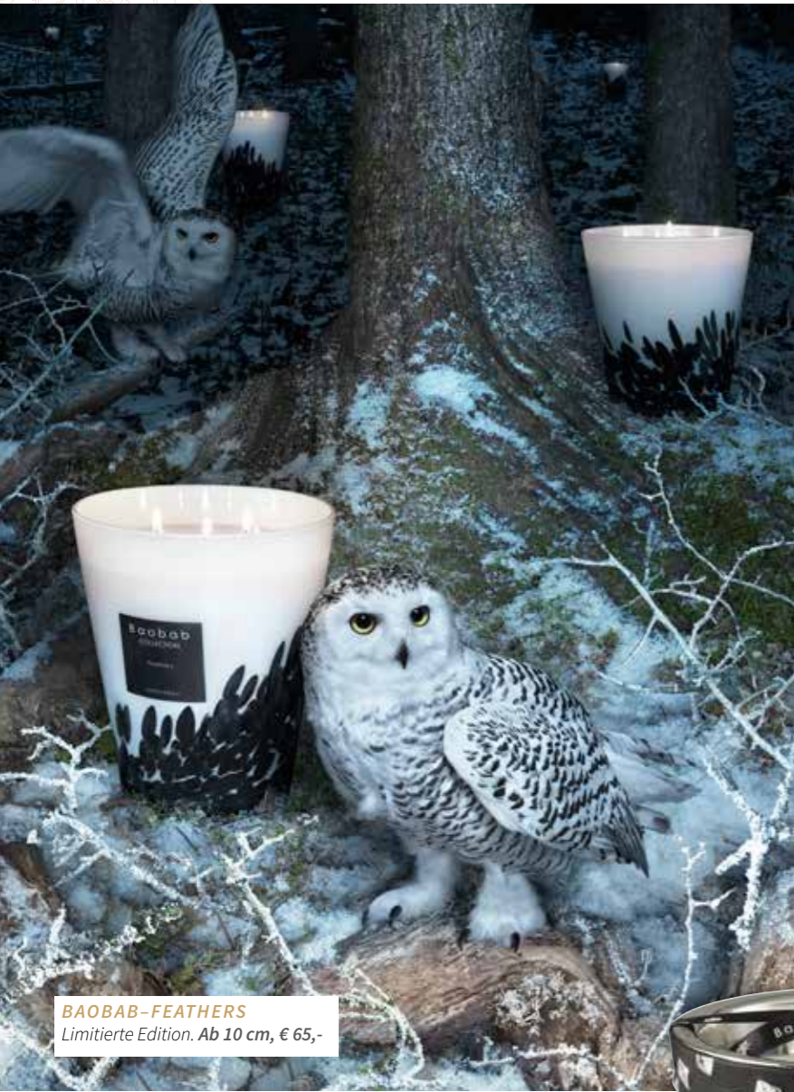
BAOBAB-FEATHERS Limitierte Edition. Ab 10 cm, € 65,-