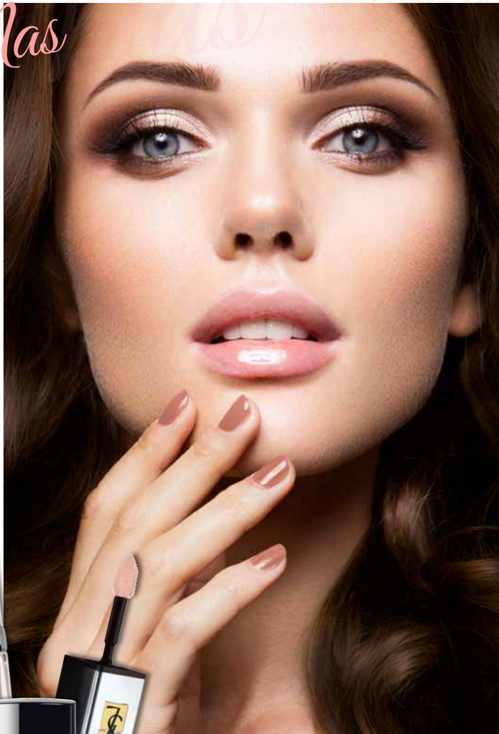
BEAUTY IS LIFE Wimpern Natural € 15,-

Wer sein Make-up lieber natürlich mag, muss auch auf den Nude-Look nicht verzichten. Allerdings erhält er dann am Abend eine große Portion Glamour. Im Mittelpunkt für diesen Look stehen die Lippen, die wie auf Hochglanz lackiert wirken. Die Augen strahlen in einem hellen Metallicton und dunklem Anthrazit, die Nägel setzen den Nude-Gedanken fort.