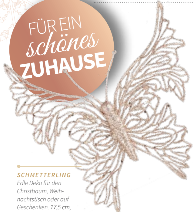
SCHMETTERLING Edle Deko für den Christbaum, Weih- nachtsstisch oder auf Geschenken. 17,5 cm, € 4,95

Jetzt zieht zu Hause der Glamour ein! Hochwertige Deko-Accessoires in Kupfer oder Silber liegen in diesem Jahr voll im Trend. Mal bezaubern sie mit schlichtem Glanz, mal funkeln Schmucksteine wie aus einem Schatzkästchen. Damit verwandeln Sie Ihr Zuhause zu Weihnachten in ein wahres Märchenland. Ganz gleich, ob Sie sich für glitzernden Baumschmuck im traditionellen Look entscheiden oder für moderne Varianten und ganz gleich, ob sie einem Look treu bleiben oder verschiedene Deko-Stile miteinander kombinieren wollen. Bei diesen Wohnideen gilt das Motto: Erlaubt ist, was funkelt.