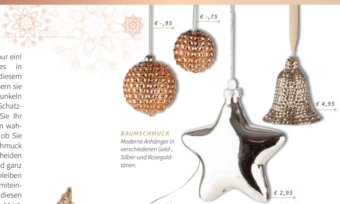
BAUMSCHMUCK Moderne Anhänger in verschiedenen Gold-, Silber- und Rosegold- tönen.

Jetzt zieht zu Hause der Glamour ein! Hochwertige Deko-Accessoires in Kupfer oder Silber liegen in diesem Jahr voll im Trend. Mal bezaubern sie mit schlichtem Glanz, mal funkeln Schmucksteine wie aus einem Schatzkästchen. Damit verwandeln Sie Ihr Zuhause zu Weihnachten in ein wahres Märchenland. Ganz gleich, ob Sie sich für glitzernden Baumschmuck im traditionellen Look entscheiden oder für moderne Varianten und ganz gleich, ob sie einem Look treu bleiben oder verschiedene Deko-Stile miteinander kombinieren wollen. Bei diesen Wohnideen gilt das Motto: Erlaubt ist, was funkelt.