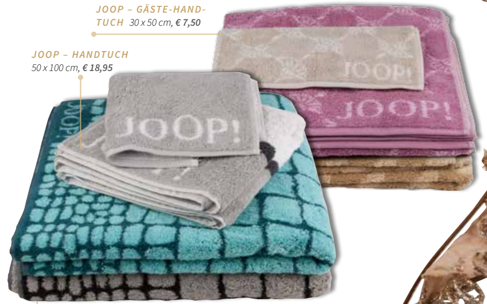
JOOP - DUSCHHANDTUCH 80 x 150 cm, € 49,95