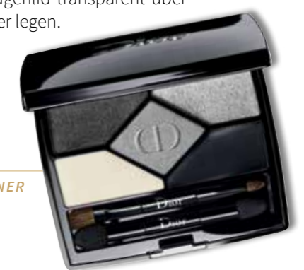
DIOR - 5 COULEURS DESIGNER Nr. 008 Smokey, € 58,-

Beinahe schon ein Klassiker: verheisungsvolle Smokey Eyes, die dem Blick Tiefe und verführerische Strahlkraft verleihen. Geschminkt wird dabei immer von dunkel nach hell und von unten nach oben. Wichtig, vor allem für den Abend: verlängernde und verdichtende Mascara für den verführerischen Augenaufschlag. Smokey Eyes gelingen z.B. mit der Lidschattenpalette „5 Couleurs Designer Smoky Design“ von Dior mühelos. Dafür sorgen die ultrafeinen Texturen, die sich auf dem Augenlid transparent übereinander legen.