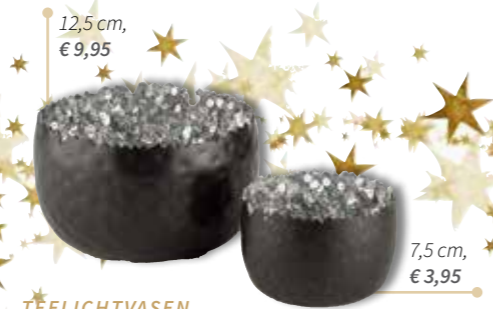
TEELICHTVASEN Stimmungsbringer in unterschiedlichen Größen und Designs.