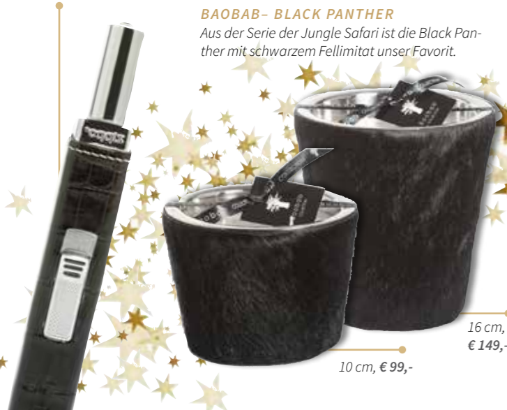
BAOBAB- BLACK PANTHER Aus der Serie der Jungle Safari ist die Black Panther mit schwarzem Fellimitat unser Favorit.